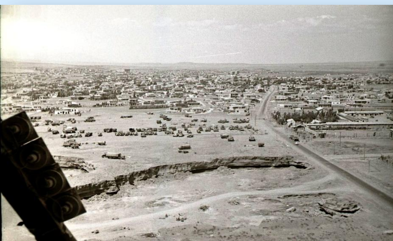
צילום ממסוק בתום המלחמה, יוני 1967