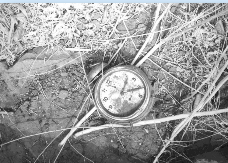
השעון שנעצר בכפר פיק, יוני 1967