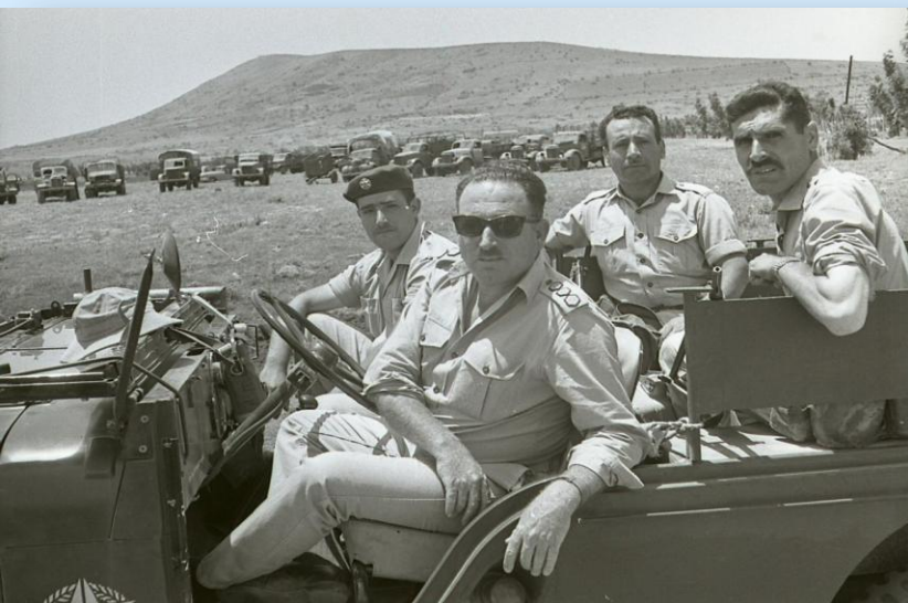
סיור בגולן אחרי המלחמה, 12.6.67