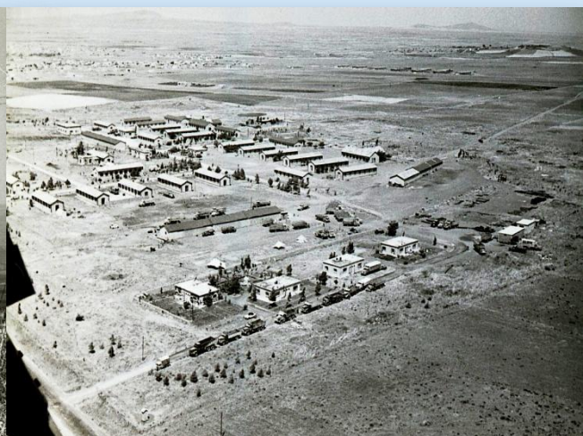
צילום ממסוק בסיום המלחמה