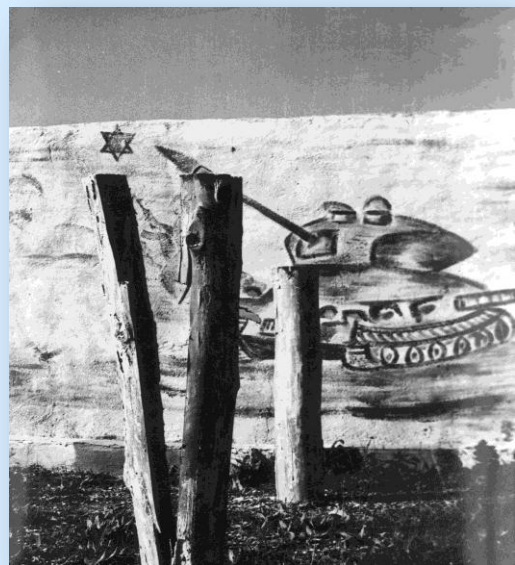
ציור קיר במחנה סורי