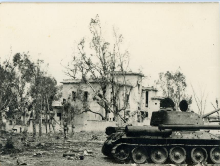
בית המכס כפי שנראה בתום המלחמה