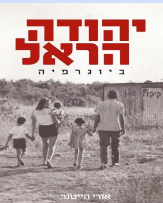
קיבוץ גולן בקוניטרה