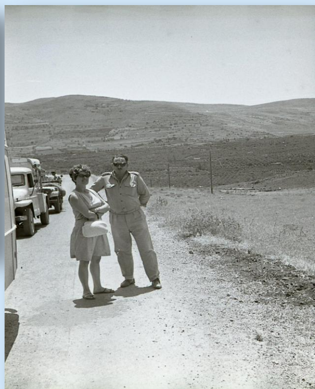
סיור ראשון בגולן, 12.6.67