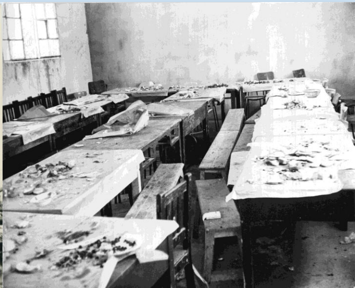
חדר אוכל קצינים סורים בחושניה