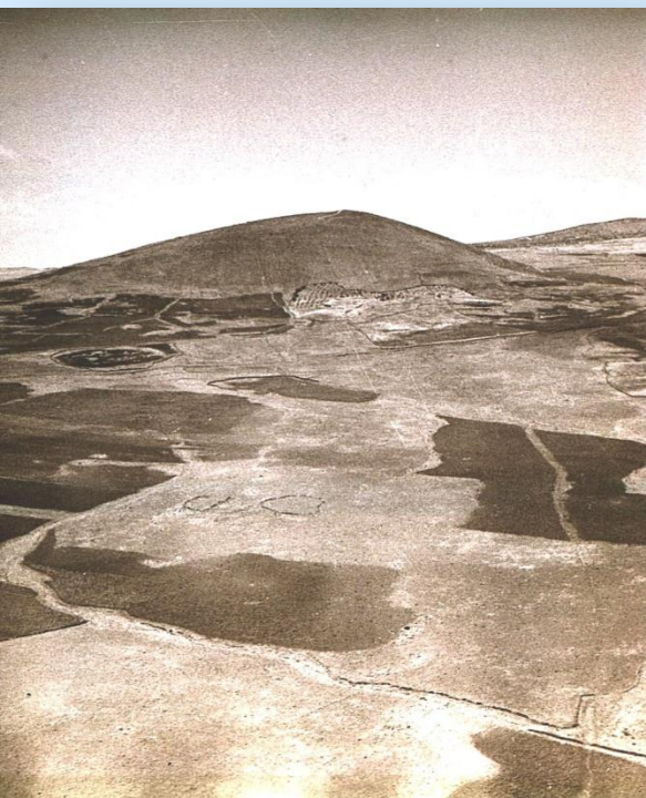
צילום ממסוק בתום המלחמה