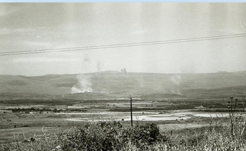
תמרות עשן על הגולן, 10.6.67