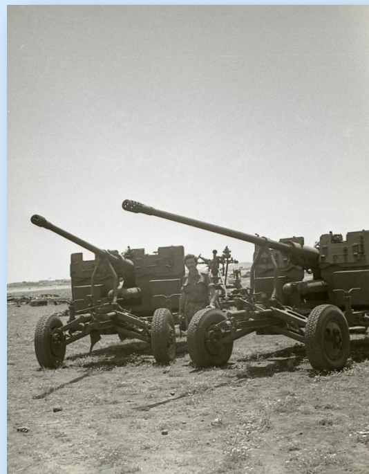
שלל סורי שנמצא בגולן, 12.6.67