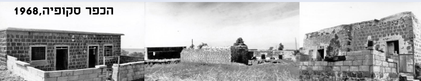
הכפר סקופיה, 1968

http://survey.antiquities.org.il/#/MapSurvey/38/site/4960