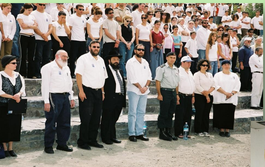
טקס יום הזיכרון בגמלא, 2004