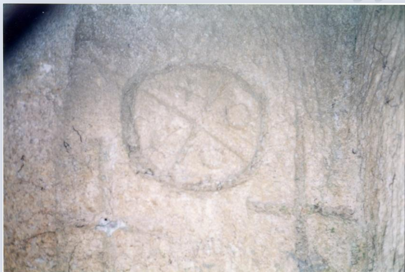
מערת הקבורה החצובה בסלע הסקוריה הטבעי. במרכזה נחקק צלב גדול