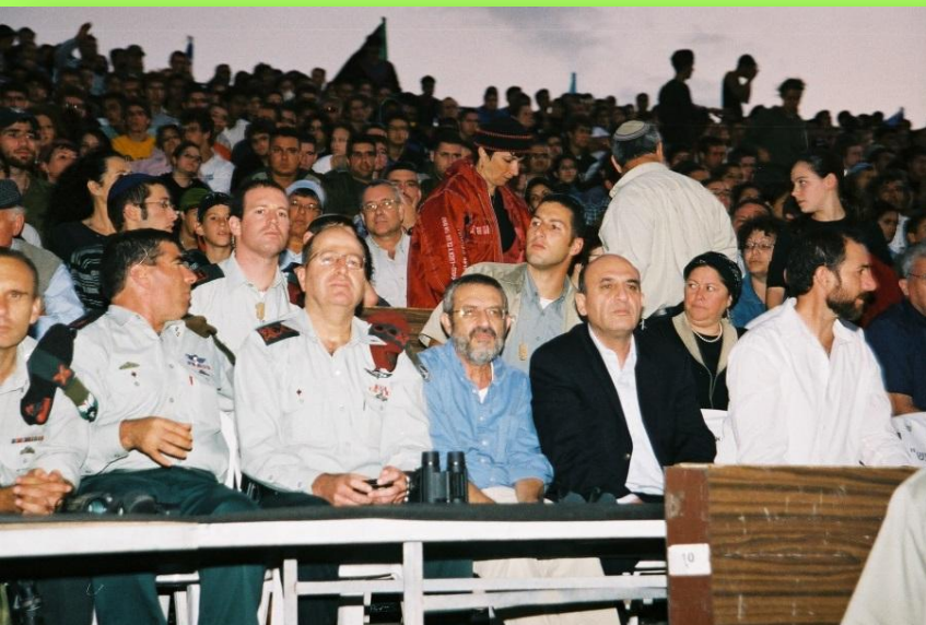
אירוע 30 שנה למלחמת יום כיפור, 2003