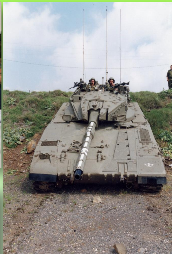
גדוד '77, 1999