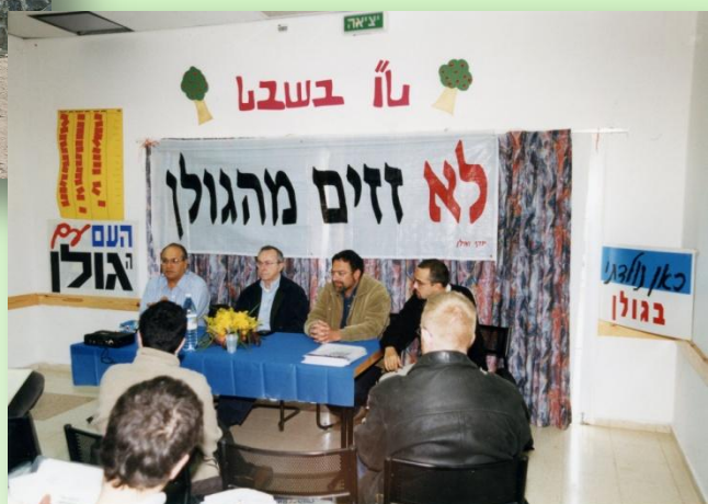
חקופת המאבק השנייה, פברואר 2000