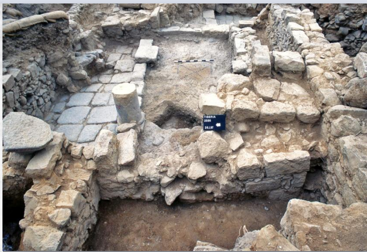
שרידי הישוב העתיק (צילום: רשות העתיקות) שרידי בית הבד בסקופיה (צילום: רשות העתיקות)