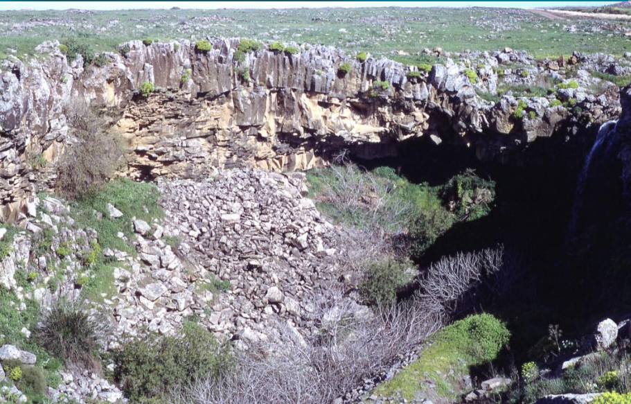
עצי מפל עיט משילים עליהם, סתיו 1975.