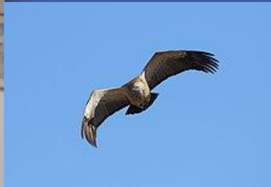
בתיה כפיר בזמן סידור חומר ארכיוני בנושא נשרים בגולן