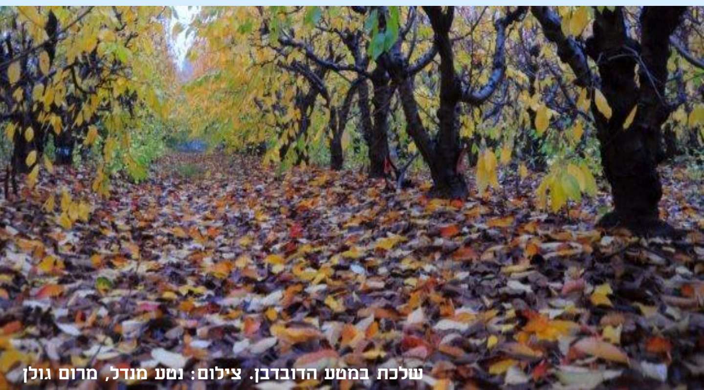
שלכת במטע הדובדבן.