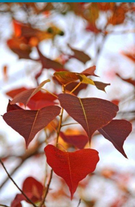
שלכת במרום גולן