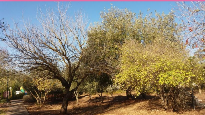
סתיו במושב קשת.