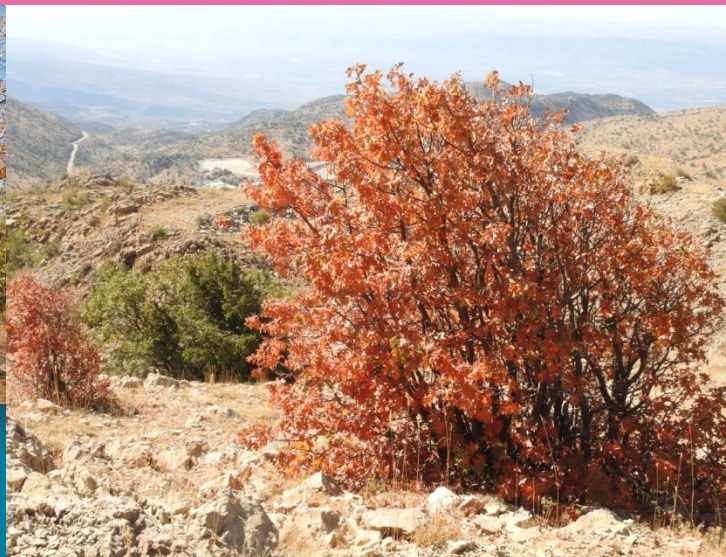
סתיו בחרמון.