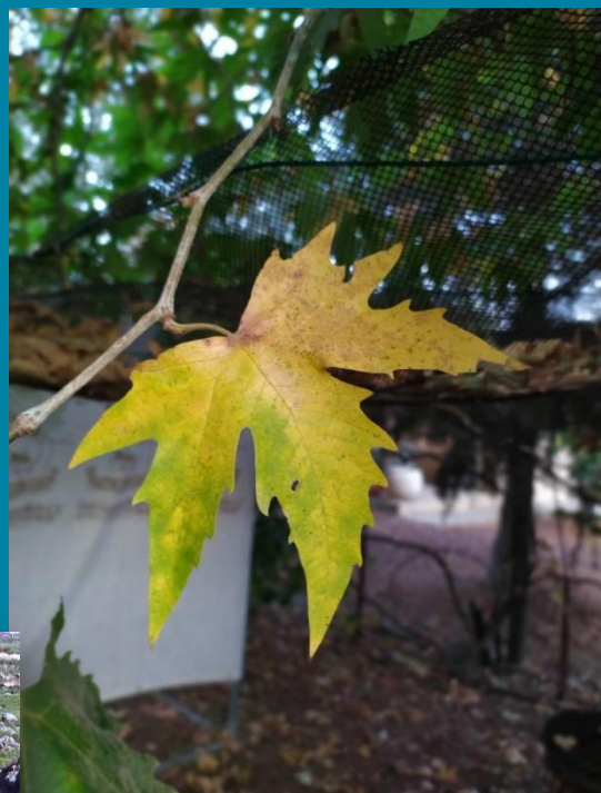
שלכת במושב שעל